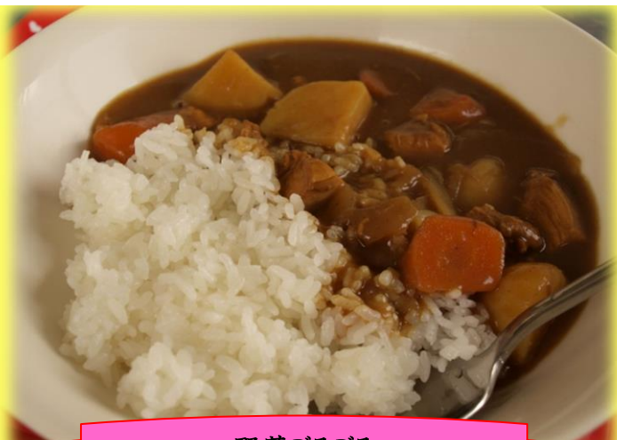
野菜ごろごろ 絶品☆チキンカレー

記念すべき第1回は、6月29日(木)に実施されました！(アドバンス通信の締め切りギリギリ…！汗！)